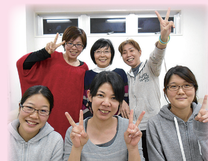
千葉中央事業所のスタッフです