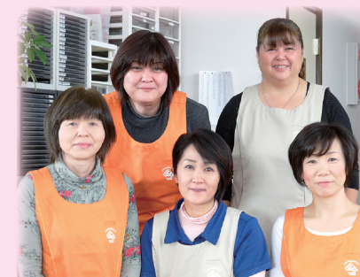
白金事業所のスタッフです

「いつでも気軽に」をモットーに、 急な業務の依頼や夜間・週末の サービスに対応できるような体制で、 皆様のご利用をお待ちしております。