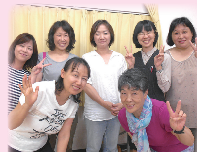
千葉南事業所のスタッフです